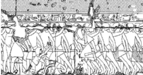
Fête d'Opet: la foule acclame la barque d'Amon

Peut-être a-t-on oublié que la civilisation égyptienne est une civilisation d'ostentation. Sinon comment expliquer cette profusion de monuments qui continuent à fasciner le public après tant de siècles. La recherche s'est focalisée sur