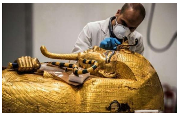
Restauration du sarcophage extérieur en bois doré de Toutankhamon.