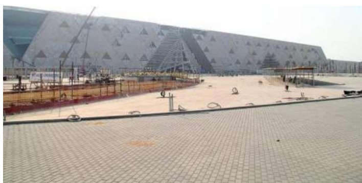
Photo du Chantier 2019

« Il aura mis tellement de temps à sortir des sables que l'on s'est parfois demandé s'il ne s'agissait pas d'un mirage. Tout est si démesuré : près de trente années de travaux, une facture dépassant le milliard de dollars (contre les 800 millions de départ), et plus de 5 000 ouvriers qui s'activent chaque jour à Gizeh , en contrebas des pyramides, pour bâtir un des plus fabuleux musées de la planète. Baptisé GEM (Grand Egyptian Museum), il doit abriter 100 000 œuvres et présenter pour la première fois, depuis sa découverte en 1922, la totalité du trésor de Toutankhamon. » Paris Match